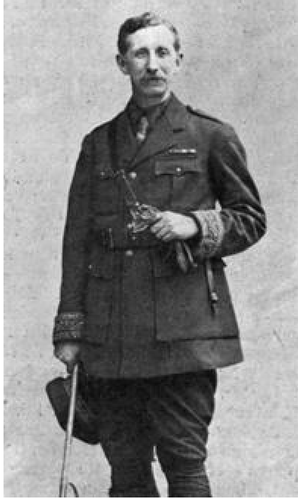
وقّع الدبلوماسي الفرنسي فرانسوا جورج بيكو معاهدة سايكس بيكو بالنيابة عن فرنسا عام 1916 . الصورة من Commons Wikimedia , 1916 .